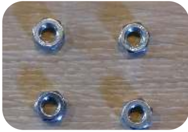
4 Muttern M6