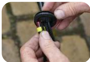
Nür bei All-in One : Am linken Rücklicht müssen auch die Stecker des Kennzeichenlichts durch diese Transittulpe eingeführt werden.