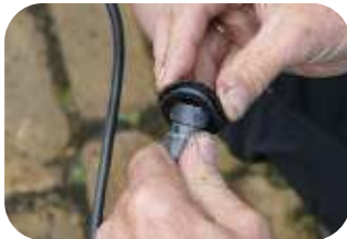
Stecken Sie die Glühbirnen durch den Durchgang

TIPP: Sie können diese auch kleben, damit sie besser an Ort und Stelle bleiben.