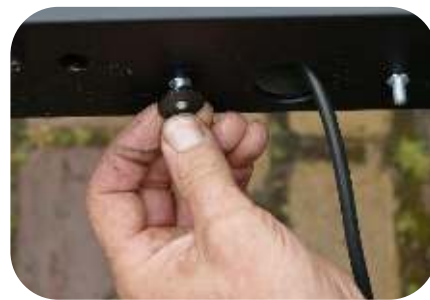
Legen Sie die schein (2 pro Lampe) über das Gewinde der Abstandsschrauben