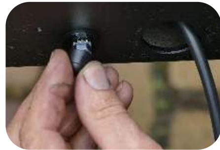
Legen Sie die Abdeckungen auf die Muttern

TIPP: Sie können diese auch kleben, damit sie besser an Ort und Stelle bleiben.