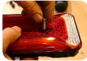
Setzen Sie die schrauben durch das Loch der Lampe ein (2 pro Lampe)