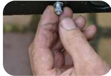
Schrauben Sie das Ganze mit den Muttern M6 max. 1 Newton