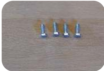
4 sechskantschrauben M6