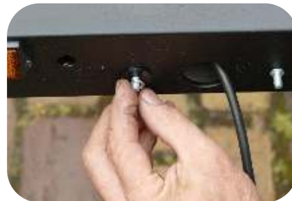
Legen Sie dann die Rändelringe (2 pro Lampe) über das Gewinde der Abstandshalterschrauben.