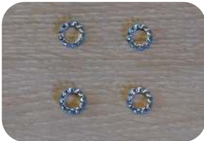
4 kartelringen M6

Plaats de zwarte kunststof sluitringen (2 per lamp) over de schroefdraad van de afstandsbouten.