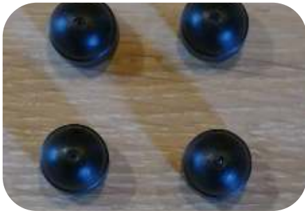
4 afdekkapjes M6

Schroef het geheel vast met de moeren M6 (4 stuks) max. 1 Newton.