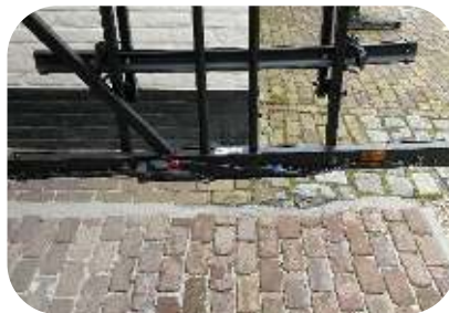
Bevestig al de bedrading met de bijgeleverde kabelklemmen aan de achterzijde van de onderste horizontale koker.