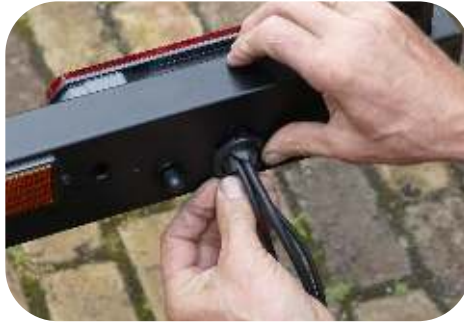
Plaats de verlichting terug