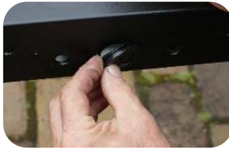
Verwijder deze Tules uit de koker