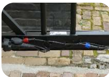
Bevestig de 13-polige stekker aan de stekkers van de lampen. Rood is rechts, blauw is links.