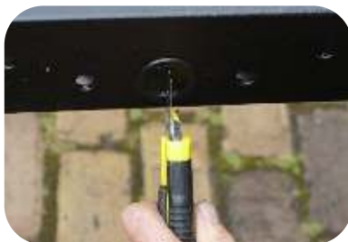
Maak een kruis met een mes in de 2 doorgangen van de onderste horizontale buis.