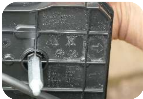
Steek beide lampen, voorzien van de afstandsbouten, door de voorziene gaten van de onderste koker.