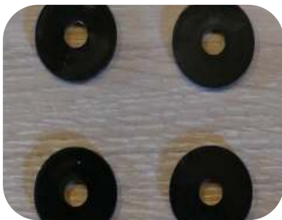
4 zwarte kunststof sluitringen

Let er wel bij op dat de pijltjes, aangeduid op de achterzijde van de lamp, naar buiten wijzen.