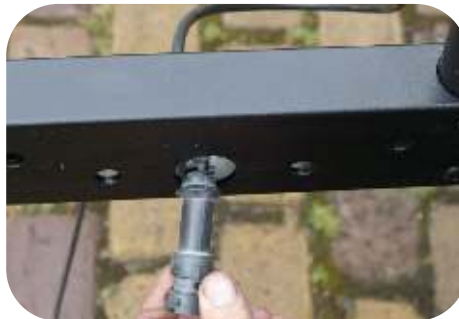
Steek de stekker van de lampen door het grootste gat (Dia. 30 mm) van de onderste koker.