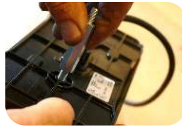
Draai de afstandsbouten op deze bevestigde schroeven (2 per lamp)