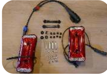
Onderdelenoverzicht van de JOKON LED verlichtingsset